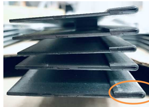
Retour « goutte d'eau »