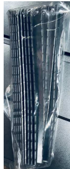
Clous et Pieux